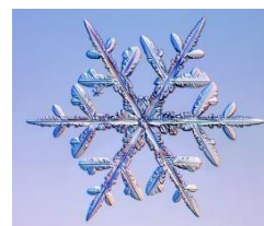
Flocon de neige

Les flocons de neige possèdent six branches car les molécules d'eau dans la glace s'organisent à l'échelle microscopique selon une structure cristalline hexagonale.