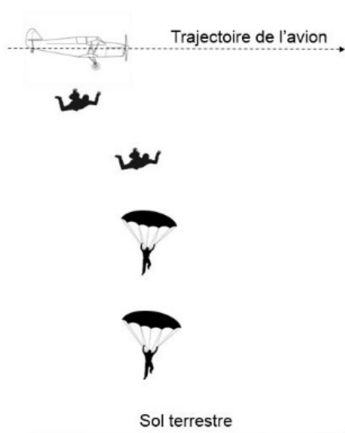
Saut depuis un avion